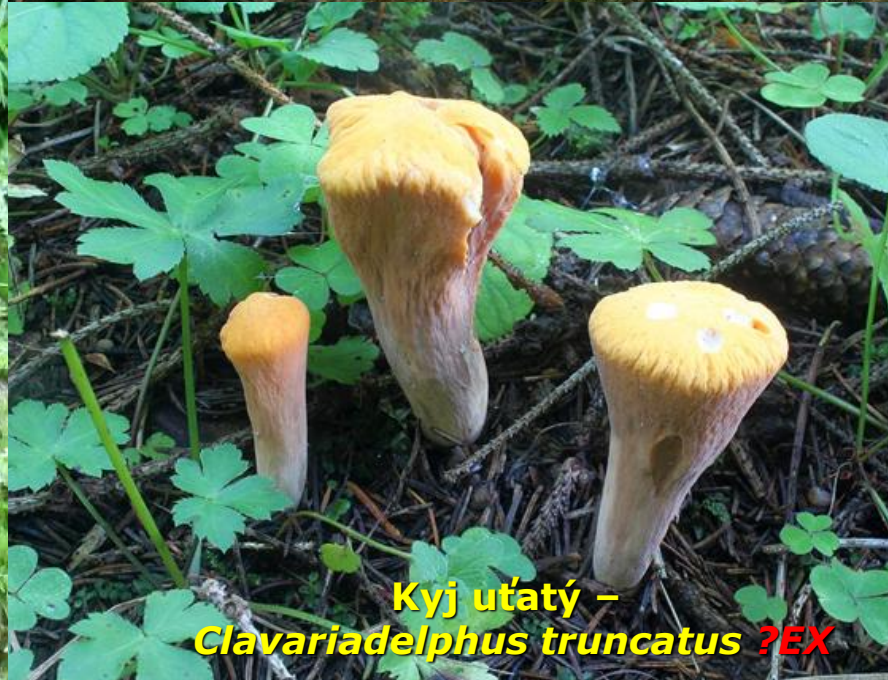
Kyj utátý – Clavariadelphus truncatus ?EX