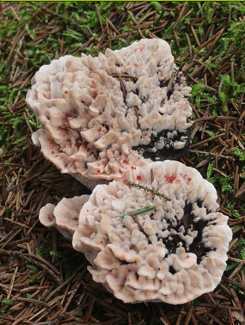
Lošákovec palčivý – Hydnellum peckii EN