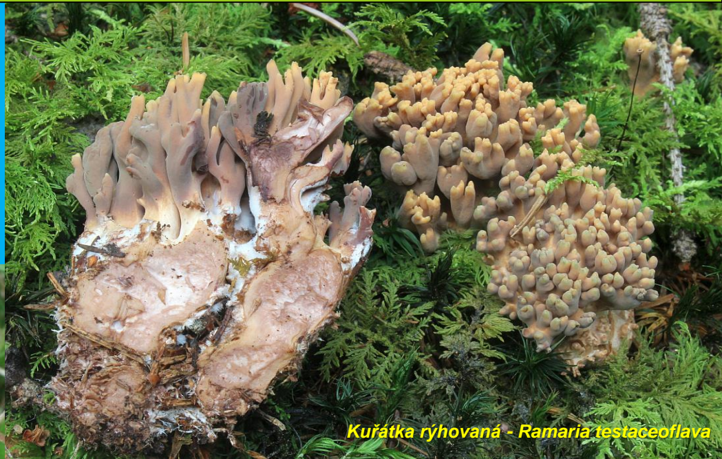
Kuřátka ryhovaná - Ramaria testaceoflava