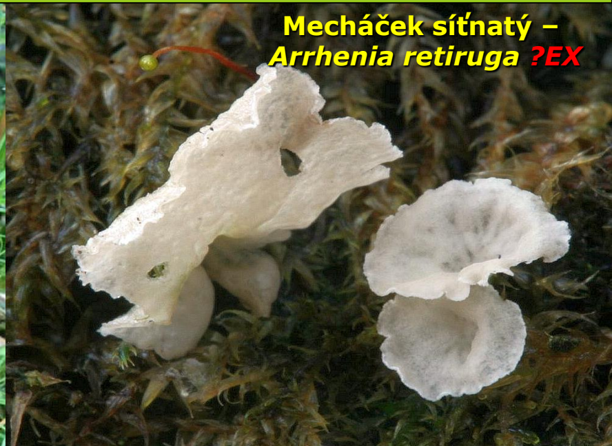
Mecháček síťnatý – Arrhenia retiruga ?EX