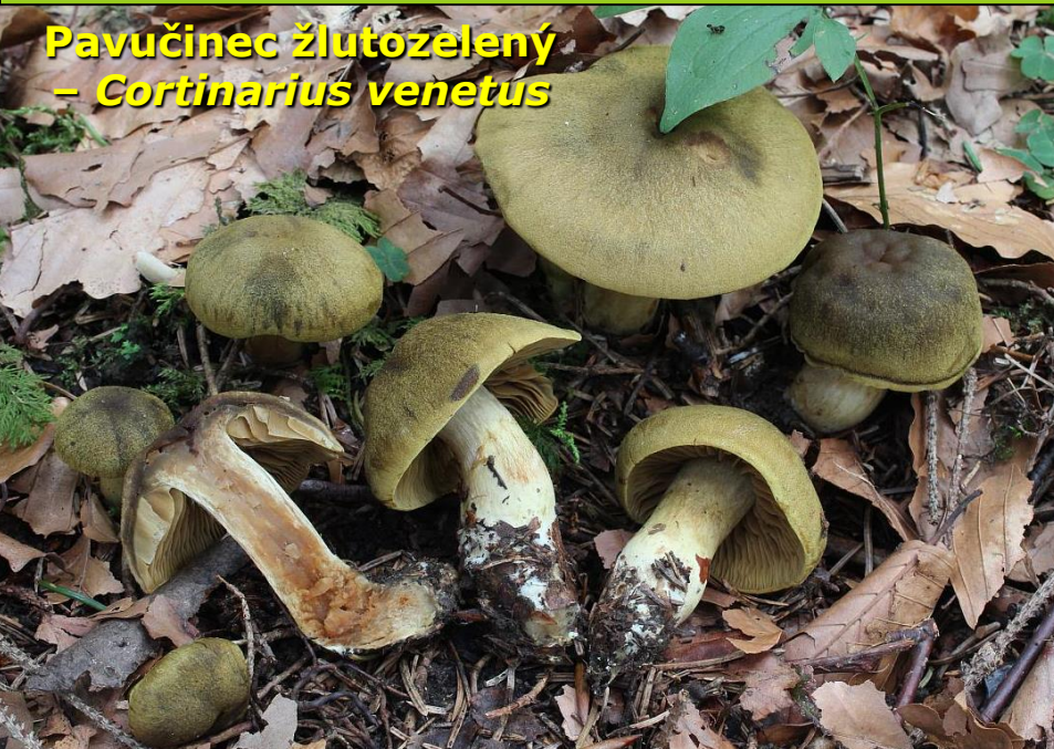
Pavučinec žlutozelený – Cortinarius venetus