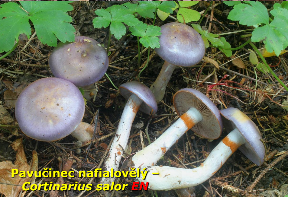
Pavučinec nařialovĕlý – Cortinarius salor EN