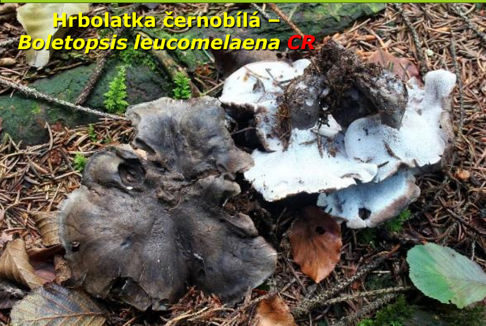
Hrbolatka černobílá – Boletopsis leucomelaena CR