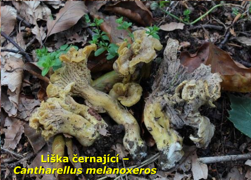
Liška černající – Cantharellus melanoxeros