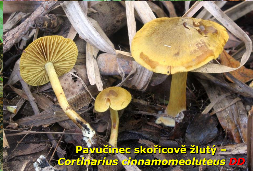
Pavučinec skořicovĕ žlutý – Cortinarius cinnamomeoluteus DD