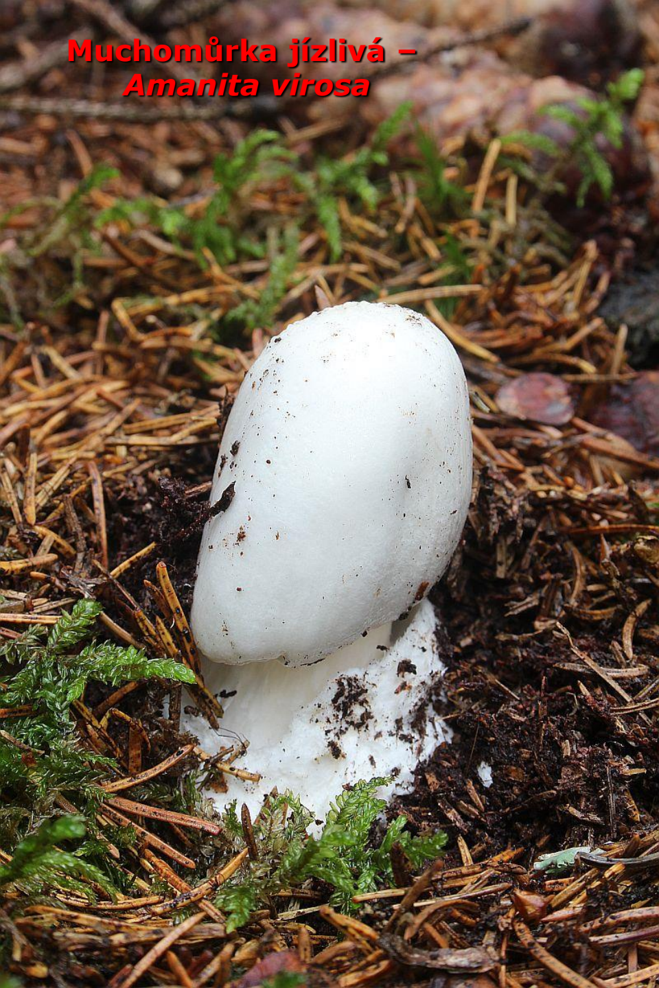
Muchomůrka jízlivá – Amanita virosa