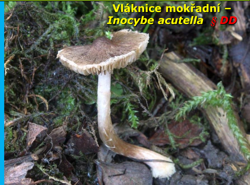
Vláknice mokřadní – Inocybe acutella § DD