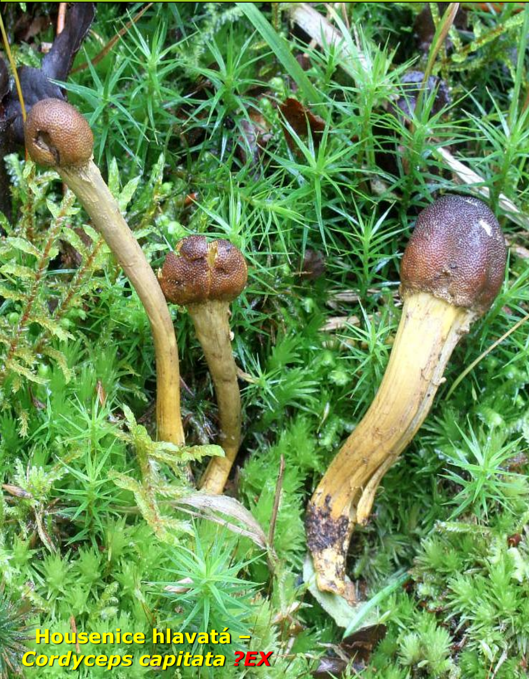
Housenice hlavatá – Cordyceps capitata ?EX