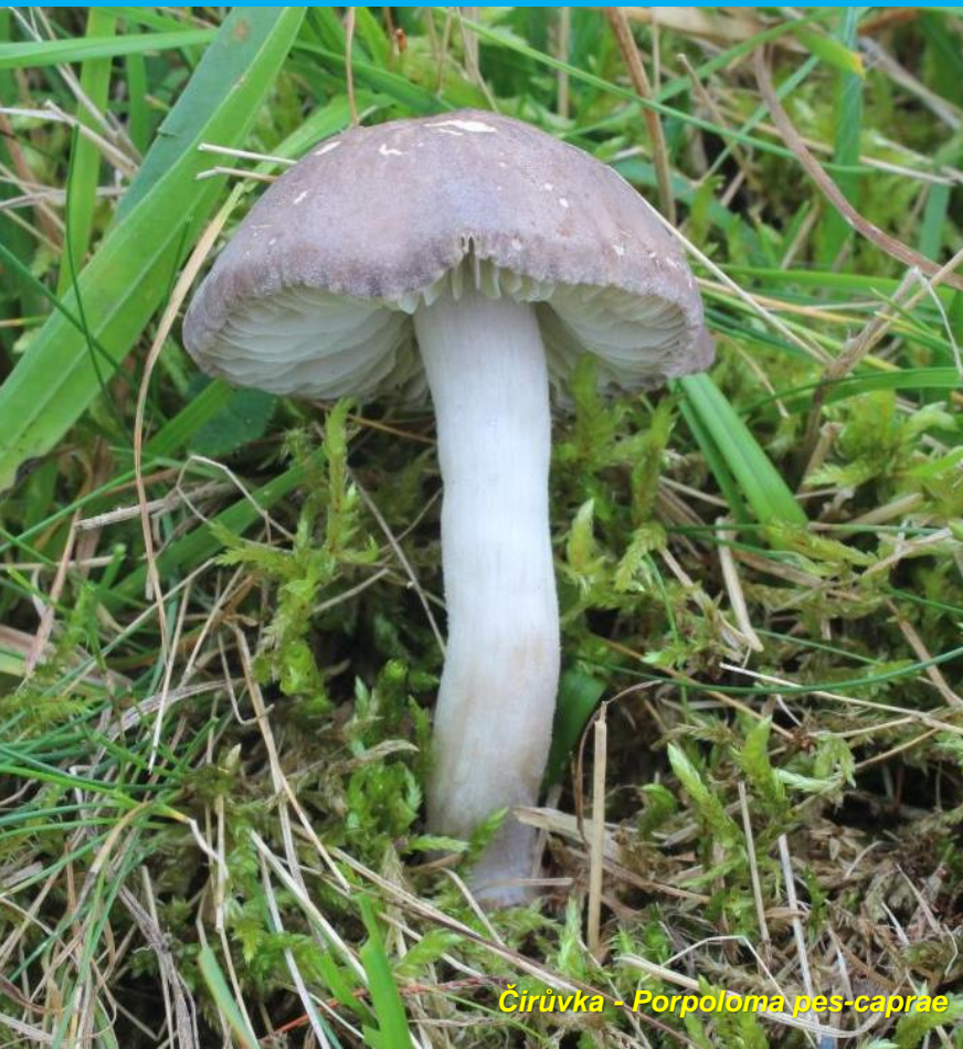
Čirůvka - Porpoloma pes-caprae