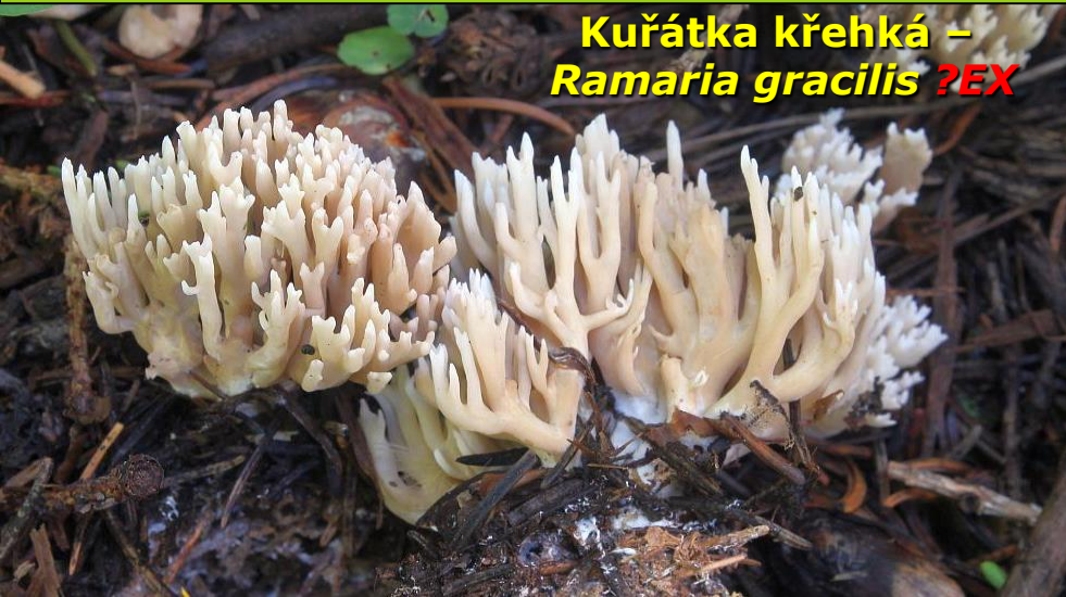
Kuřátka křehká – Ramaria gracilis ?EX