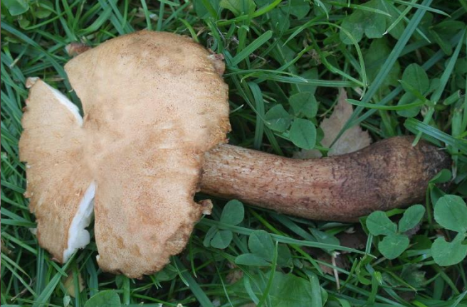
Čirůvka hnědočervenavá – Tricholoma inodermeum § DD