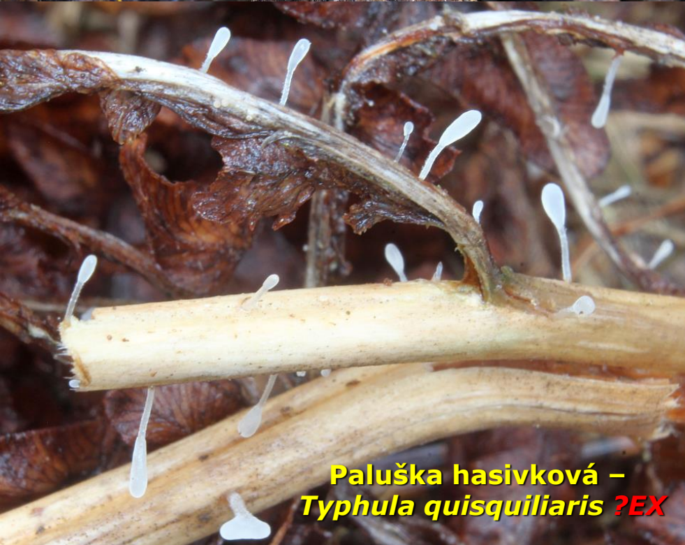
Paluška hasivková – Typhula quisquiliaris ?EX