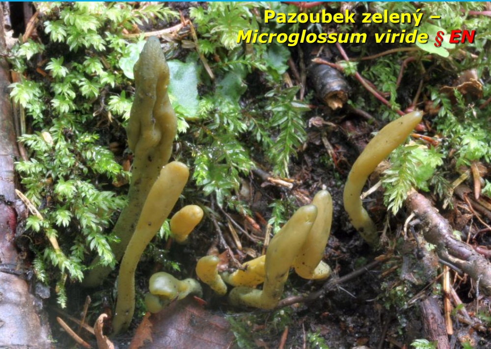
Pazoubek zelený – Microglossum viride § EN