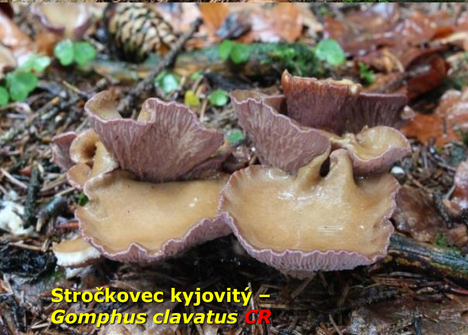
Stročkovec kyjovitý – Gomphus clavatus CR