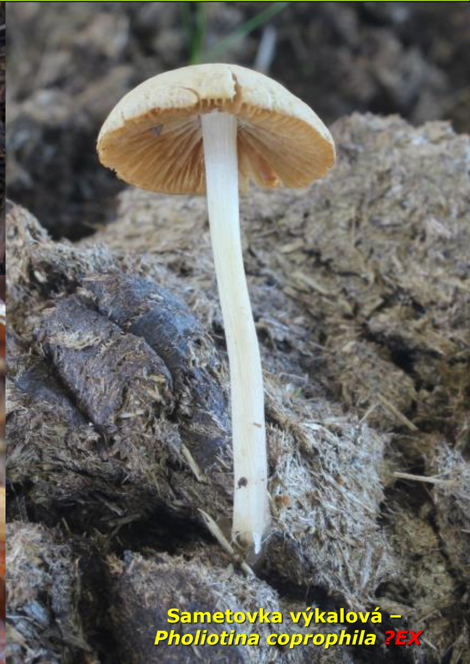
Sametovka výkalová – Pholiotina coprophila ?EX