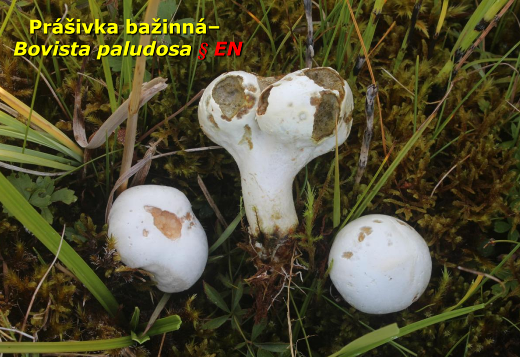
Prášivka bažinná – Bovista paludosa § EN